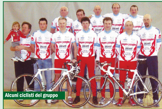
Alcuni ciclisti del gruppo

Dopo un periodo di lontananza si è riformata la "Società Ciclistica Gazoldesi".